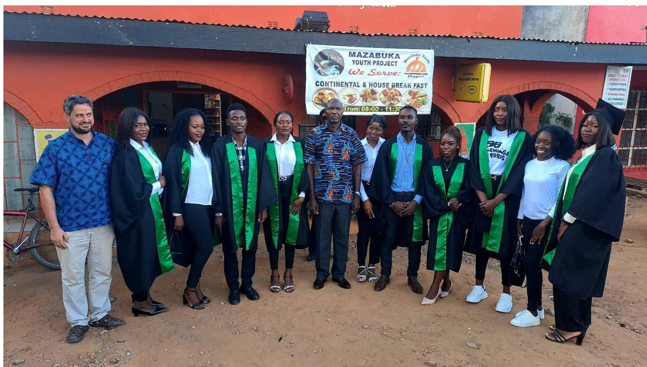
Gli studenti graduati con il Distric Commissioner