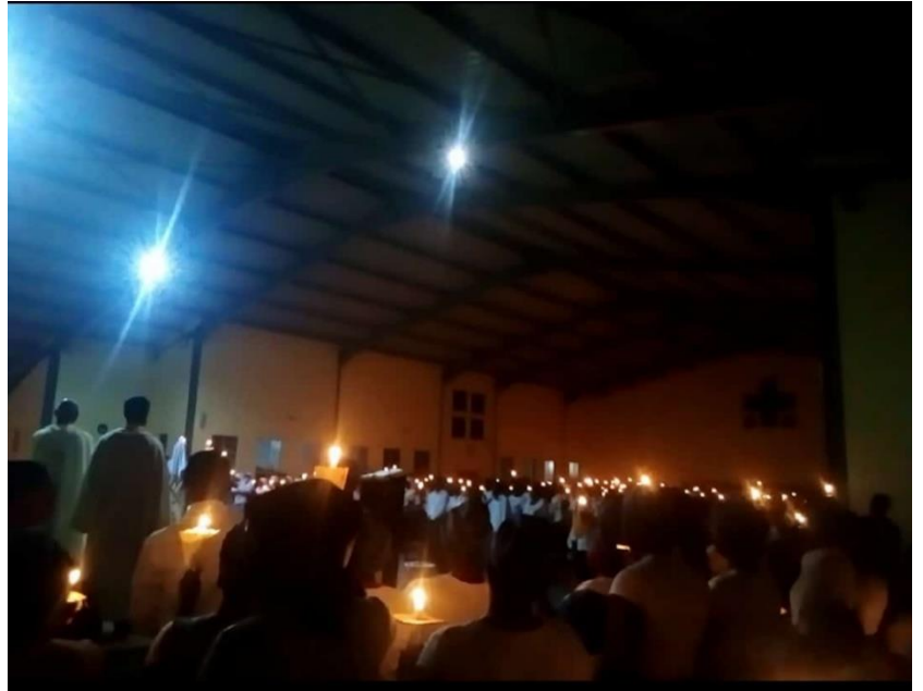
L'inizio della veglia pasquale

Uno dei momenti più attesi dell'anno con i giovani della parrocchia, è la tre giorni insieme che da qualche anno facciamo presso la casa delle suore salesiane. Il programma prevede incontri, preghiera, giochi e serate insieme. L'inizio era per le 17 di martedì 30 aprile e esattamente alle 17, in modo del tutto imprevisto e ovviamente senza preavviso, la ZESCO (società elettrica dello Zambia) ha tolto la corrente. Cinquanta adolescenti nel buio africano. C'era da perdere la calma ma non mi sono minimamente scomposto e segno che lo Zambia sta avendo un benefico effetto su di me. Qui niente è più prevedibile degli imprevisti ma mi pare di avere imparato che gli zambiani sono anche bravissimi ad aggirarli e che, buttar via il programma, non sarebbe stato un grosso problema. Semplicemente abbiamo iniziato spostando l'altare nel cortile dove c'era ancora un po' di luce, e abbiamo iniziato la Messa. La luce piano piano è calata fino a lasciarci tutti nell'oscurità rotta solo da una candela sull'altare e dalla torcia del mio cellulare per permettermi di leggere il messale. Nessuno si è scomposto e la Messa