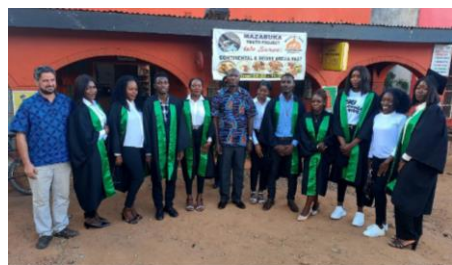
Gli studenti graduati con il District Commissioner